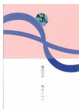
『魔法の丘』 (2017) 思潮社

1988年生まれ。詩人。『ウイリスちゃん』で中原中也賞、『魔法の丘』で鮎川信夫賞を受賞。最新刊『紫雲天気、嗅ぎ回る 岩手歩行詩篇』。