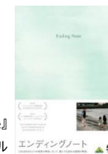
『Ending Note』 (2012) バンダイビジュアル

1978年生まれ。映画監督、小説家。映像作品『エンディングノート』『夢と狂気の王国』、著作『音のない火花』『一瞬の雲の切れ間に』など。