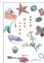
『消えていく日に』 (2018) 徳間書店

1983年生まれ。歌人、小説家。主な著作に『ハッピーアイスクリーム』（歌集）、『誕生日のできごと』『あとは泣くだけ』『消えていく日に』など。