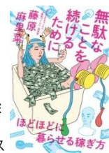
『無駄なことを続けるために - ほどほどに暮らせる稼ぎ方 -』 (2018) ヨシモトブックス

1993年生まれ。メイカー、文筆家、映像作家。2013年からYouTubeチャンネル「無駄づくり」を開始。今まで200個以上の unnecessary なものを作る。