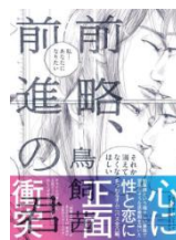
『前略、前進の君』 (2018) 小学館

1981年生まれ。漫画家。主な著作に『おんなのいえ』『先生の白い嘘』など。最新刊『前略、前進の君』『マンガリン・ジブシーキャットの籠城』。