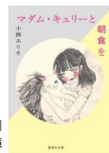
『マダム・キュリーと朝食を』 (2018) 集英社文庫

1978年生まれ。作家、マンガ家。主な著作に『光の子ども1,2』（漫画）『マダム・キュリーと朝食を』『彼女は鏡の中を覗きこむ』など。