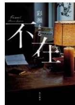
『不在』 (2018) KADOKAWA

1986年生まれ。小説家。主な著作に『くちなし』『不在』『暗い夜、星を数えて 3・11 被災鉄道からの脱出』（ノンフィクション作品）など。