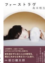
『ファーストラヴ』 (2018) 文藝春秋

1983年生まれ。小説家。主な著作に『リトル・バイ・リトル』『ナラタージュ』『Red』『夏の裁断』など。『ファーストラヴ』で直木賞を受賞。