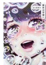
『彼女は宇宙一』 (2018) KADOKAWA

1988年生まれ。漫画家。主な著作に『人生山あり谷口』『彼女は宇宙一』、料理本『放っておくだけで、泣くほどおいしい料理ができる』など。