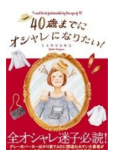
『40歳までにオシャレになりたい!』 (2018) 扶桑社

1979年生まれ。ライター、大学講師。主な著作に『バンカーキ・ノート』『大学1年生の歩き方』（共著）『40歳までにオシャレになりたい！』など。