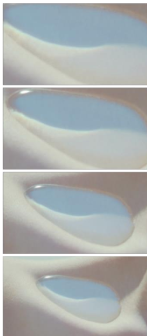
水のある肌景 2015 15 sec.