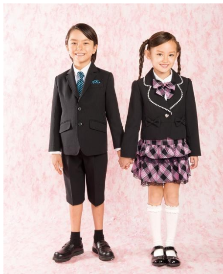
(右・左) フォーマルセット ¥6,990 (税抜・セール価格)

http://www.motherways.com/shop/?utm_source=pr&utm_medium=web&utm_campaign=pub