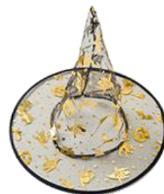
ユニセックスハロウィングッズ ゴールドプリントとんがりハット ゴールド 販売価格：500円+税