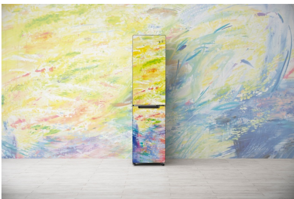
植田志保氏「芽ぐるいろ」 (JU-RSX21MCL) 使用イメージ