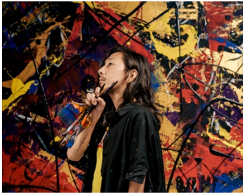
富永ボンド氏 作品：「FLOWER」 (JU-RSX21MCM)

プロフィール 美術作家。色に立脚した純粋芸術の活動を軸に、対話描画、装画、ライブペイント、舞台の空間演出を手掛けるなど、創作は多岐にわたる。国内外での個展多数。近年は公共空間の再生事業にも取り組む。記憶や意識に潜む色を捉えた心象風景を描き続けている。