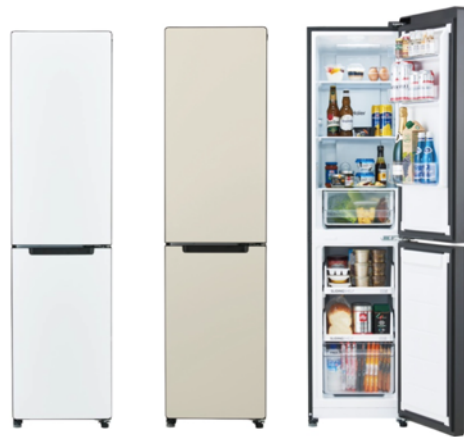
JR-SX21A(W//パールホワイト) JR-SX21A(C//ナチュラルベージュ)

208L 冷凍冷蔵庫(JR-SX21A)『freemo』は、幅約 45 cmのスリムボディながらも、74L 収納可能な「ジャイアントフリーザー」を装備した製品です。壁際にフィット設置しても 90°ドア開閉で中身の出し入れが可能な構造を採用し、置き場所を選ばず自在に設置いただけます。