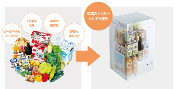
※JF-WNC100A(W)冷蔵保存食品イメージと収納イメージ合成画像

JF-WNC142A と JF-WNC100A はダイヤルを合わせるだけで冷蔵に切り替えが可能。大家族で冷凍冷蔵庫に入りきれないビールや2Lペットボトルなどのドリンク類もバックごと収納可能。また、傷みやすいお米や野菜もまるごと入れることができ、かさばる食品の冷蔵ストッカーとしても役立ちます。