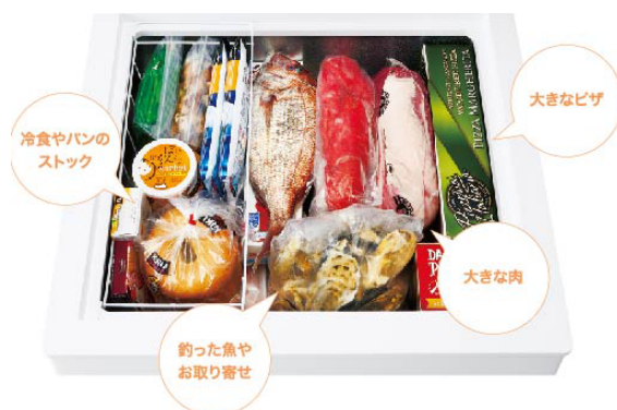
※JF-WNC142A(W)冷凍保存イメージ

本製品は、仕切りがないので大きな肉や魚などの食品を出し入れしやすい上開き式冷凍庫です。本機で採用した「直冷式」は、冷気が逃げにくく、食品をしっかり冷凍することができます。さらに、急冷凍に設定が可能で、急いで冷凍したいときに便利です。生鮮食品や冷凍食品のまとめ買い、ふるさと納税返礼品など大量の食品の長期保存をサポートいたします。