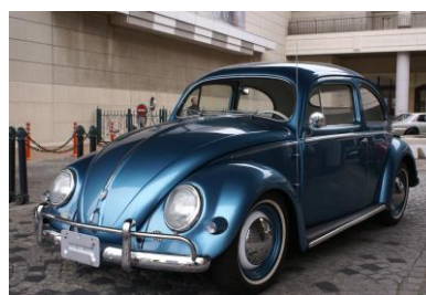
フォルクスワーゲン ビートル タイプI(ドイツ)