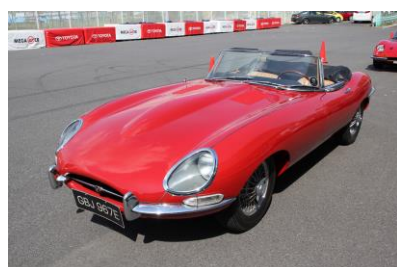
ジャガー Eタイプ ロードスター(イギリス)