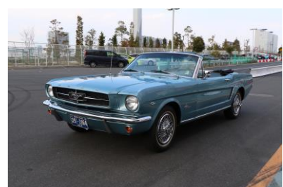
フォード マスタング コンバーチブル(アメリカ)