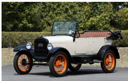
フォード モデルT ツーリング(アメリカ)