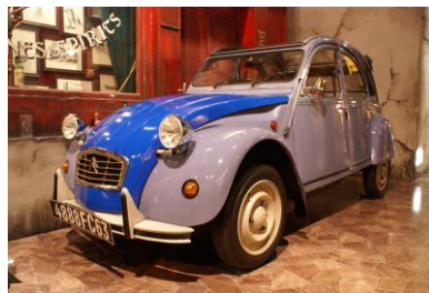
シトロエン 2CV6 スペシャル(フランス)