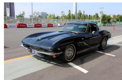
GM シボレー コルベット ステイングレイ(アメリカ)