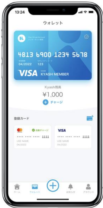
ウォレット画面からチャージ可能