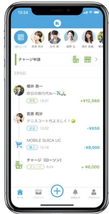
ホーム画面から申請一覧を確認

コンビニまたは銀行口座から残高をチャージすると、送金やお買い物にご利用いただけます。詳しいご利用方法はご利用ガイド*をご確認ください。