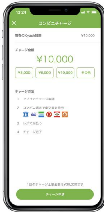
金額のみの入力がかんたん申請