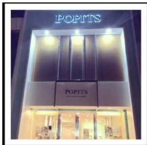
POPITS Store in Bali

現在、ハワイを含む、日本、台湾、中国、韓国、カナダ、パリ、インドネシア、オーストラリア、フィジーなど 11 か国で展開しています。