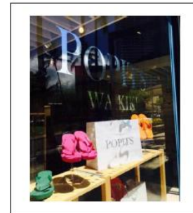
POPITS Store in Hawaii