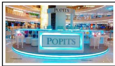
POPITS Store in Indonesia