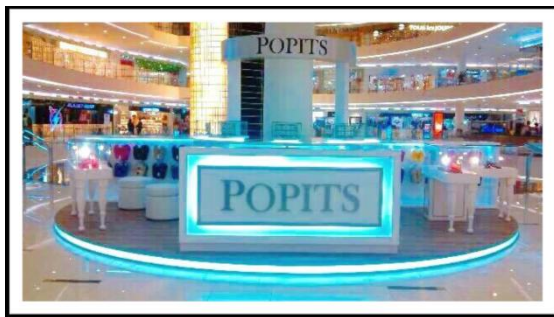
POPITS Store in Indonesia