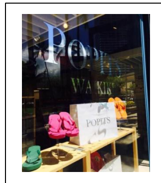
POPITS Store in Hawaii