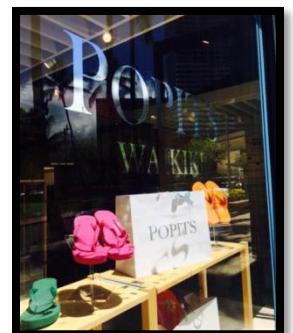
POPITS Store in Hawaii