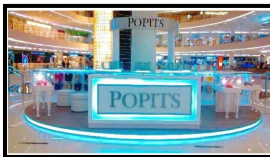
POPITS Store in Indonesia