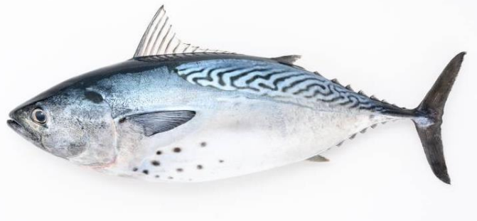
カツオに似ている「媛スマ」