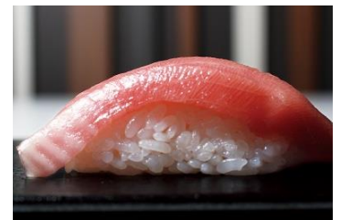
まるでトロのような『愛媛県産 媛スマ』

商品についてのお問い合わせ先：ライドオンエクスプレスお客様相談室 0120-594-096