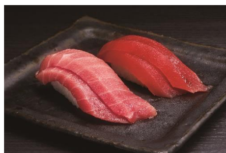
二重ネタイメージ (左) 二重中トロ・(右) 二重マグロ