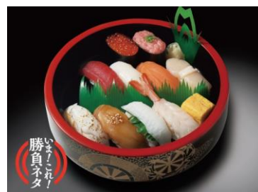
紬（つむぎ）1人前 1,814 円（税込）