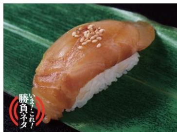
づけ白寿真鯛 324 円（税込）