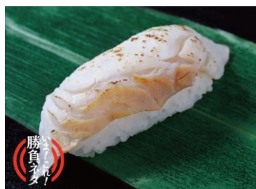
炙り白寿真鯛 324 円（税込）

『づけ白寿真鯛』は、漬けダレによって少しネっとりとした味わいになり、「炙り」とはまた違った印象をお楽しみいただけます。淡泊で旨みの強い『炙り白寿真鯛』と、タレの味がしみ込んだ『づけ白寿真鯛』。悩んだらどちらもいかがでしょうか。2種類を味わえる1人前桶『紬（つむぎ）1人前』もご用意しました。