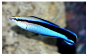
ホンソメワケベラ

場所：館内1F大水槽「サンシャインラグーン」、冷たい海」水槽、館内2F「大河アマゾン川」水槽