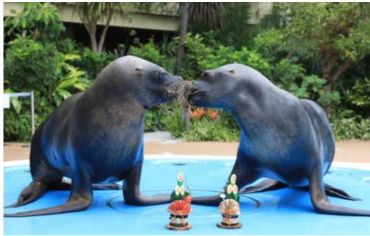
アシカのトレーニング

富と幸運をもたらす魚として知られるアロワナやドラドが、門松を背景に豪快にジャンプする姿が見られるエサやり解説、お正月らしい小物を使用したアシカトレーニング、おみくじ型のフィーダーを器用に扱うカウソなど、縁起担ぎにぴったりな、普段と違ういきものディスカバリー。「いつ」「どこで」「何が」起こるか分からない、わくわく感も満載です。