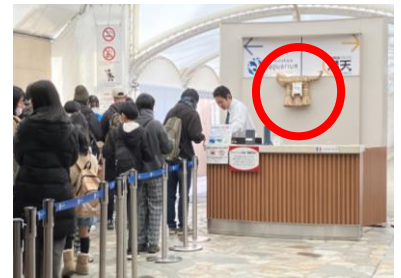
ベチバーしめ縄は、サンシャイン水族館のウェルカムカウンターに飾られます

※画像はイメージです。※金額はすべて税込です。※状況により、内容・スケジュールが変更になる場合がございます。