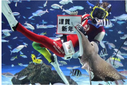
大水槽「サンシャインラグーン」でのエサやり