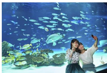
水族館の貸切体験

サンシャイン水族館オリジナルグッズとともにサンシャイン水族館でしか味わえないプレミアムな体験が、必ず当たる「 プレミアム福袋 」を12月21日(土) 12:00より販売します。2025年にちなみ25,000円で25個限定販売で「一生の思い出」を作る特別な体験を提供します。※なくなり次第終了