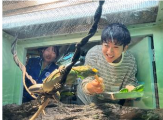
トカゲ飼育スタッフ体験