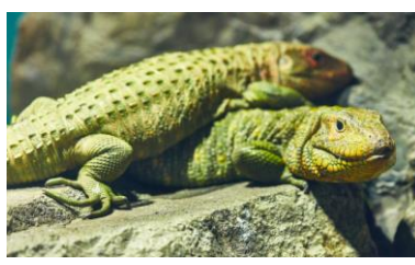
ガイアナカイマントカゲ(定期的に脱皮)