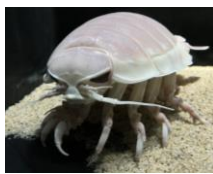
ダイオウグソクムシ