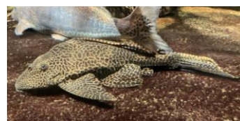
セルフィンプレコ

※状況により、内容・スケジュールが変更になる場合がございます。※画像はイメージです。