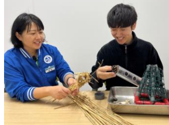
カウソのフィーダー作り体験