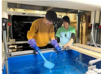
クラゲ飼育スタッフ体験