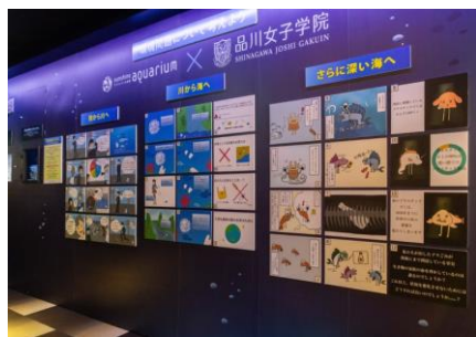
学生が制作した展示物

講義を通して、海洋プラスチック問題を次世代に伝えるための展示や発信方法についてのプレゼンテーションも行われ、学生のアイデアを取り入れ、学生が制作した展示物をサンシャイン水族館内に展示しました。