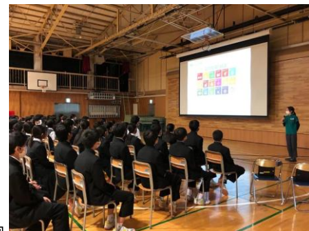
豊島区立駒込中学校での出張授業の様子