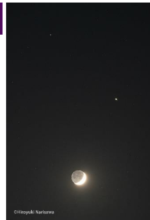
【月と木星と土星が接近した写真（イメージ）】