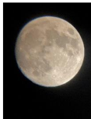
【学習用天体望遠鏡（NEWTONY）で撮影した月】

※状況により、変更となる場合があります。悪天候の場合でもワークショップは開催します。