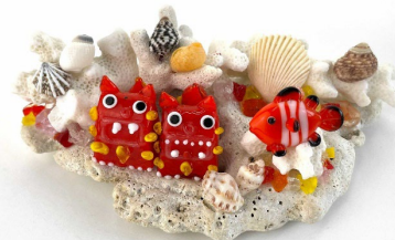
ワークショップ 上：シーサーオブジェ 下：メモスタンド