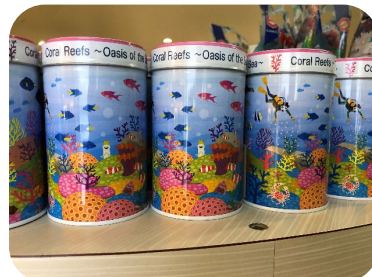
サンシャイン水族館オリジナル チョコクリームロール 626円

※サステナビリティ バッグは、100%ペットボトルリサイクルできた環境へ配慮した製品です。 また、売り上げの一部がJAZA(日本動物園水族館協会)に寄付されます。