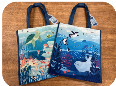
サステナビリティ バッグ 550円

ショップ アクアポケットでは、サンゴフェスタの開催を記念してエコやサンゴにちなんだ商品を販売します。