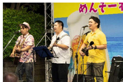
三線ライブイメージ