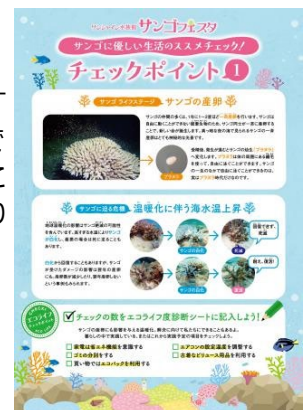
サンゴ解説パネル

申し込み方法：水族館エントランス 年間パスポート発行カウンターにてお手続きください。 ※先着順（10名様）となります。※別途水族館入場料が必要です。