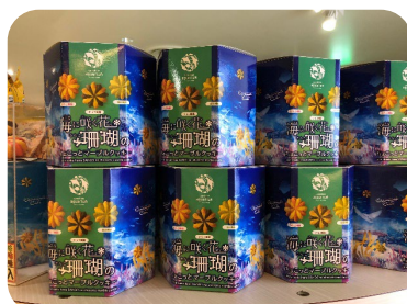
海に咲く花 珊瑚のマーブルクッキー 540円