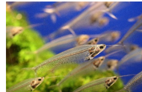
トランスルーセントグラスキャットフィッシュ

※状況により、内容・スケジュールが変更になる場合がございます。※画像はイメージです。※金額はすべて税込です。