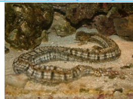
オオイカリナマコ