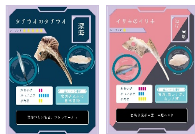
かくれんボーンカード

硬骨魚の胸びれあたりにある魚の形にそっくりな骨。タイ（鯛）の形に似ていることから「タイのタイ」と呼ばれる。