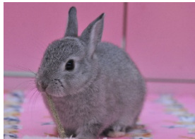
ネザーランドドワーフ