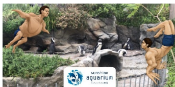
オリジナルフレームでの写真撮影