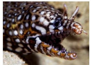
トラウツボ 答え：第2の顎がある