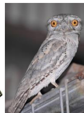
オーストラリアガマグチヨタカ