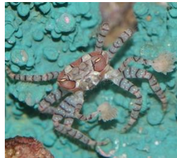
キンチャクガニ 答え：チアリーダーになる