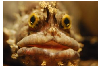
フサギンボ 答え：顔がチャーミングすぎるから