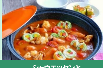
シャウエッセンと プチロールキャベツのトマト鍋