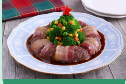
クリスマスミートローフ