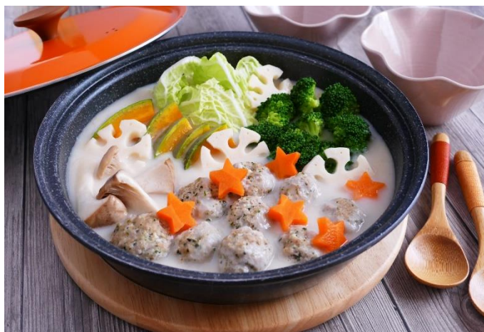
お子様から大人まで一緒に囲む「あったか鍋」