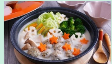
ふんわり肉団子のシチュー鍋