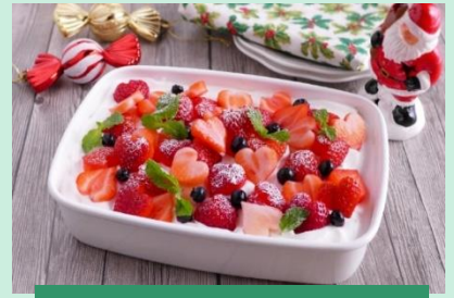
クリスマス風スコープケーキ