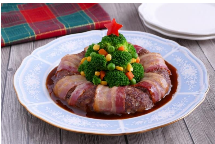
冬のパーティーシーンにあわせた「わいわいクリスマス」