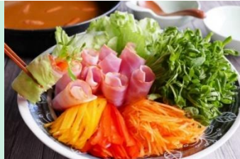
レタス巻きしゃぶしゃぶカレー鍋

注1)メニューレシピ内の( )は企業名の略称です。 (オ) オタフクソース株式会社 / (永) 株式会社永谷園 (二) 日本ハム株式会社 / (ハ) ハウス食品株式会社