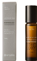
ロールオンフレグランス