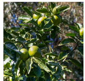
産地：高知県 宿毛市/高知市 抽出部位：果皮

https://www.at-aroma.com/sourcingstory/story.php?sid=635