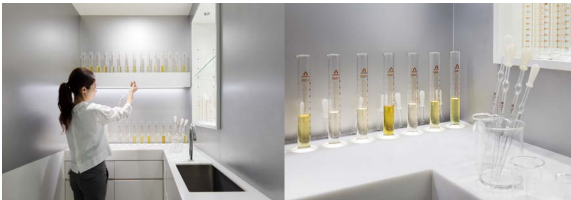
※外観・店内画像はイメージです

直営ストアでは初となる調合スペースは、まるでラボのようにスタイリッシュに設えられた空間です。「アロマオイルブレンダー®」で制作したオリジナルアロマを、専門スタッフが丁寧に一つひとつ調合していく様子をゆっくりとご覧いただくことができます。また、ご自宅や店舗にアロマ空間デザインを導入したいという方には、香りやディフューザーの選び方をサポートするカウンセリングサービスも実施予定です。その他、ワークショップやイベント開催など、コミュニケーションのためのスペースとしても活用してまいります。