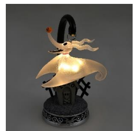
LED ライト 7,150 円