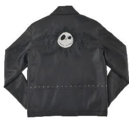
ライダーズジャケット 17,600 円