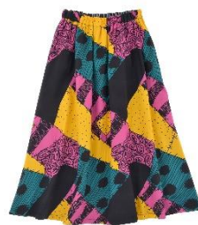
リバーシブルスカート 7,260 円