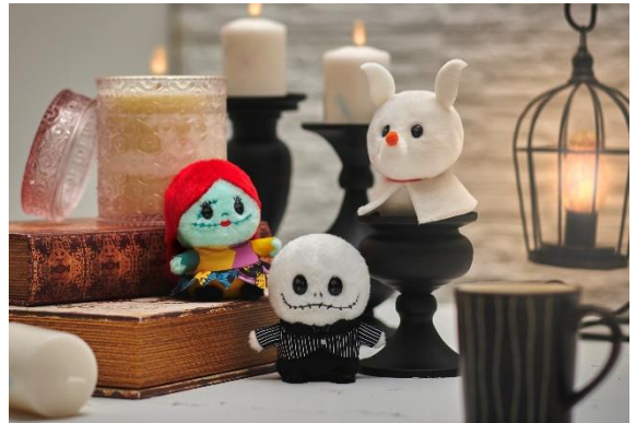
【画像掲載商品】 うるぼちやちゃん ぬいぐるみ 各 1,100 円

うるんだ瞳とぼつちやりとしたふわふわなボディがキュートなぬいぐるみシリーズ「うるぼちやちゃん」から、『ティム・バートン ナイトメアー・ビフォア・クリスマス』のジャック・スケリントン、サリー、ゼロのぬいぐるみが新登場します。特徴的なフェイスやコスチュームなどキャラクターらしさはそのままに、「うるぼちやちゃん」らしくキュートに表現されたファン必見のアイテムです。