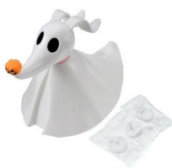
タブレット 2,500 円