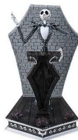
LED ライト 7,480 円