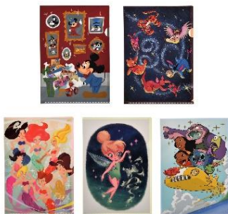
クリアファイルセット 660 円