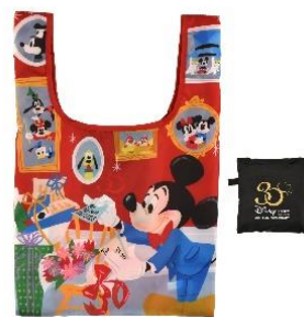
エコバッグ 1,210 円