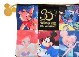
ポーチ 2,640 円