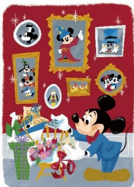
【30周年をお祝いする特別なアート】

今回のシリーズでは、グローバルに活躍する5人のディズニーアーティストが、ディズニーストア30周年のお祝いをテーマにオリジナルアート開発を手掛けています。ミッキー・マウス、プーと仲間たち、ティンカー・ベル、アリエルと6人の姉妹、スティッチとオハナをそれぞれのアーティストがフィーチャーし、30年間支えていただいた感謝の気持ちと、これからもゲストのみなさまとずっと繋がりが明るい未来へ向かっていきたいという想いを表現しています。また、アートや商品には“30”の文字がさりげなく隠れており、遊び心あふれるコレクションになっています。