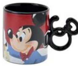
マグカップ 1,980 円