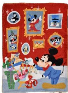
ブランケット 4,400 円