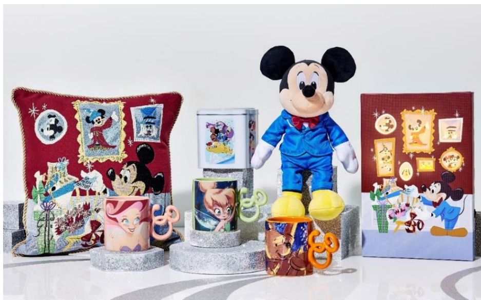
【画像掲載商品】 クッション 4,180円 マグカップ 各 1,980円 缶入りクッキー 1,620円 ぬいぐるみ 4,290円 アートボード 3,300円

今回のシリーズでは、グローバルに活躍する5人のディズニーアーティストが、ディズニーストア30周年のお祝いをテーマにオリジナルアート開発を手掛けています。ミッキー・マウス、プーと仲間たち、ティンカー・ベル、アリエルと6人の姉妹、スティッチとオハナをそれぞれのアーティストがフィーチャーし、30年間支えていただいた感謝の気持ちと、これからもゲストのみなさまとずっと繋がりが明るい未来へ向かっていきたいという想いを表現しています。また、アートや商品には“30”の文字がさりげなく隠れており、遊び心あふれるコレクションになっています。