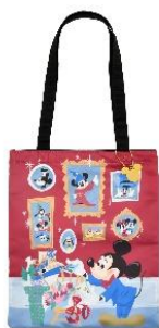
トートバッグ 2,970 円