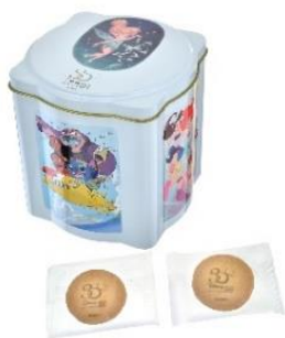
缶入りクッキー 1,620 円