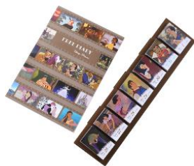
卓上日めくり付せんカレンダー 3,630 円