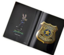
手帳＜『ズートピア』＞ 880 円