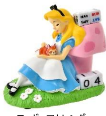
フィギュアカレンダー ＜『ふしぎの国のアリス』＞ 3,300 円