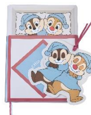
手帳＜チップ＆デール＞ 2,200 円