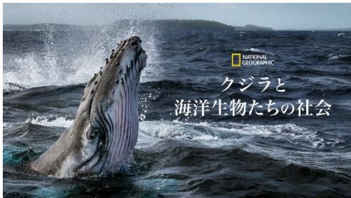
『クジラと海洋生物たちの社会』

ディズニープラス公式動画配信サービス「Disney+（ディズニープラス）」では、4月22日（木）より『タイタニック』、『アバター』のジェームズ・キャメロン製作総指揮による奇跡の海洋ドキュメンタリー・シリーズ、『クジラと海洋生物たちの社会』を配信します。