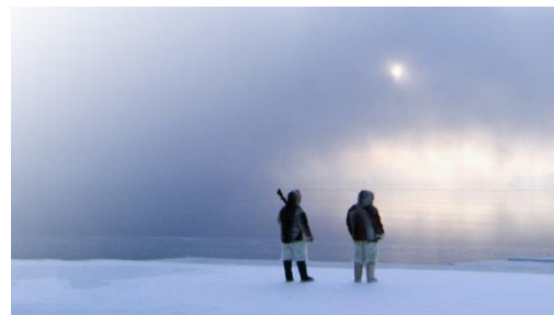
『ラスト・アイス』 © National Geographic

全国のケーブルテレビおよびスカパー！などで放送中のドキュメンタリー専門チャンネル、ナショナル ジオグラフィックでは、アースデイ当日に 24 時間、野生動物や環境問題に関する全 14 番組を一挙にお届けする特集『アースデイ with ナショナル ジオグラフィック』を放送。日本初放送となる『キングダム・オブ・チャイナ：隠された大自然「山で生き残る術」』では、中国の大自然を舞台に、珍しい動物たちの姿を美しい映像とともに紹介します。また、同じく日本初放送の『ラスト・アイス』では、地球温暖化の多大な影響を受ける北極圏とそこに住むイヌイットの暮らしに迫ります。大自然を迫力ある映像でお楽しみください。