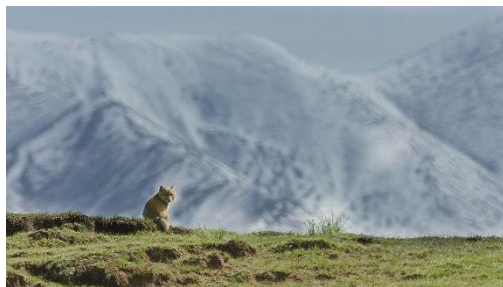
『キングダム・オブ・チャイナ：隠された大自然』