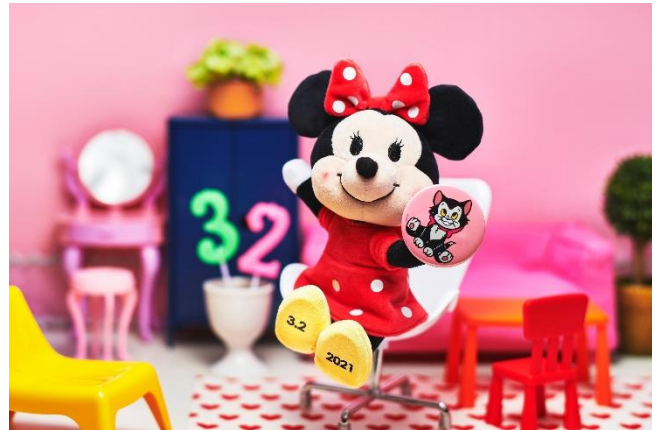
【画像掲載商品】 nuiMOs ぬいぐるみ 2,750 円

ミニーの足に記念日である2021年3月2日のプリントを施し、フィガロデザインの缶バッジがついたぬいもーずは、ミニーにちなんで320点限定発売。今回のためだけに作られたスペシャルなぬいもーずに、ぜひご注目ください。