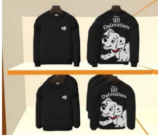
3D 加工したさまざまな商品の展示 ©Disney