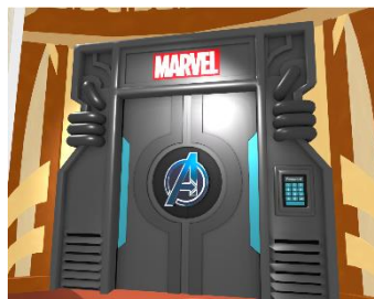
マーベルヒーローたちのパネルや等身大の「アイアンマン マーク6」が並ぶ「マーベル」エリア