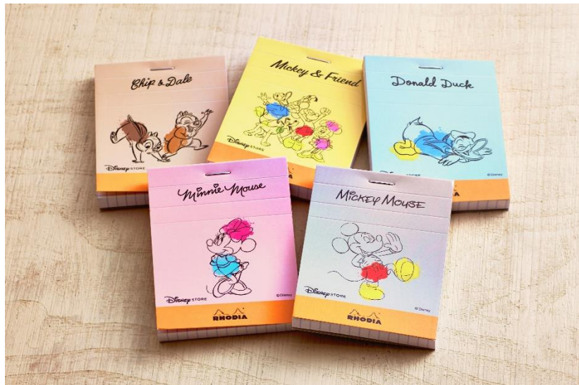
ブロックロディア No.11（全5種類） 各300円（税抜）

は、メイドインフランスの撥水・耐水性に優れたカバーと自社工場で製紙した高品質な用紙でスムーズな書き味が魅力の世界中から愛されるステーショナリーブランドです。今回の共同企画により、RHODIAの定番商品の表紙にフルカラーでディズニーストアオリジナルデザインを施した、特別な商品が誕生しました。