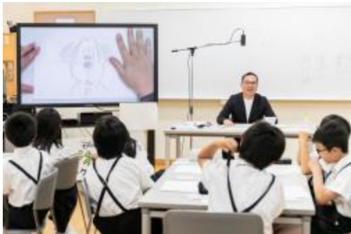
▲福岡県・麻生学園小学校での様子

ミッキーを通して想像力を膨らませた後は、ディズニーのアーティストが登場し、子どもたちの前でミッキーを描きました。アーティストの手によって紙と鉛筆から生き活きとミッキーが描かれる様子を目の当たりにし、会場からは歓声が上がりました。アイデアを紙に描く上で大切なことについて、アーティストは「上手に描こうと思わなくてもいい。失敗を恐れずにのびのびと描きましょう。」と話しました。