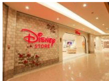
アミュプラザ博多店

ディズニーストアは、ディズニーキャラクターの人気グッズや最新情報、ここでしか出会えないオリジナルグッズが盛りだくさんのディズニー公式のキャラクターグッズ専門店です。