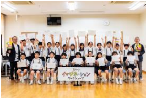
▲福岡県・麻生学園小学校での様子

「ディズニー イマジネーション ワークショップ」を九州にて開催 九州で体験できる、ディズニーの様々な取り組みも展開中！