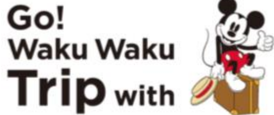
キャンペーンロゴ

JR九州では、ミッキーマウスのスクリーンデビュー90周年を記念し、「Go! Waku Waku Trip with MICKEY」プロジェクトを展開中です。車内にも特別な装飾を施し、見ること・乗ること自体がワクワクするような「JR九州 Waku Waku Trip 新幹線」を5月17日（金）より運行開始しました。九州限定のオリジナルグッズが販売されているほか、現在、「JR九州 Waku Waku Trip 新幹線」の運行を記念して、Waku Waku Trip 隊第二弾を募集するキャンペーンを実施中です。