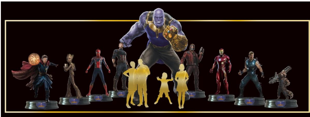
「アベンジャーズエクスクルーシブストア by ホットトイズ」(原宿)

『アベンジャーズ／インフィニティ・ウォー』は、昨年11月に予告編が公開されると24時間で史上最多の再生回数2億3000万回を記録。日本のみならず、世界中のマーベルファンが公開を心待ちにしている最新作です。劇場公開に先駆け、渋谷・原宿エリアを中心に都内ではマーベル商品の限定ショップや体験スポットがオープン。そこでしか手に入らない限定商品の販売はもちろん、映画で使用したコスチュームの展示やキャンペーン実施など、お出かけしたくなるスポットが続々と登場します。さらに、マーベルの世界にどっぷりと浸れるブルーレイ&DVDやサウンドトラックも発売。劇場公開前に、マーベルの熱をさらに熱くする、ファンの皆様楽しんでいただける様々な企画を展開します！