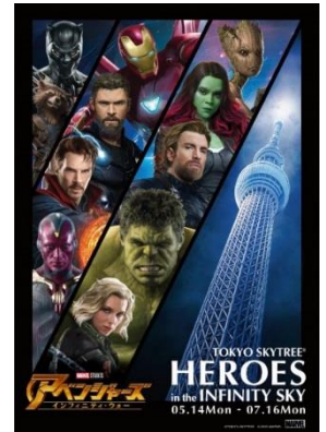
TOKYO SKYTREE® HEROES in the INIFINITY SKY