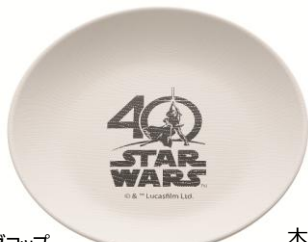
木目プレート スクーター/1,300円 /4月発売