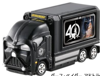
ダース・ベイダー アドトラック -40周年記念- タカトミー/850円 /4月下旬発売