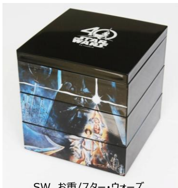
SW お重/スター・ウォーズ 前畑/7,500円 /4月末発売