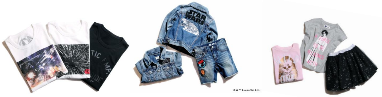
Men's Tシャツ/Gap/4,900円/ 4月26日発売