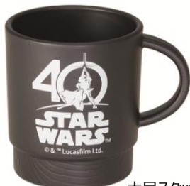
木目スタッキングコップ スクーター/1,000円 /4月発売