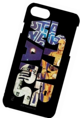
(STAR WARS 40 th Anniversary) iPhone7対応3Dハードケース STW-65B R2D2&C-3PO ガルマンディース/2,680円 /4月25日発売