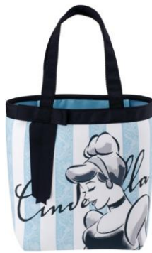
■ミニトートバッグ ¥2,500