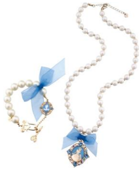
■パールブレスレット ¥3,000 ■パールネックレス ¥3,500