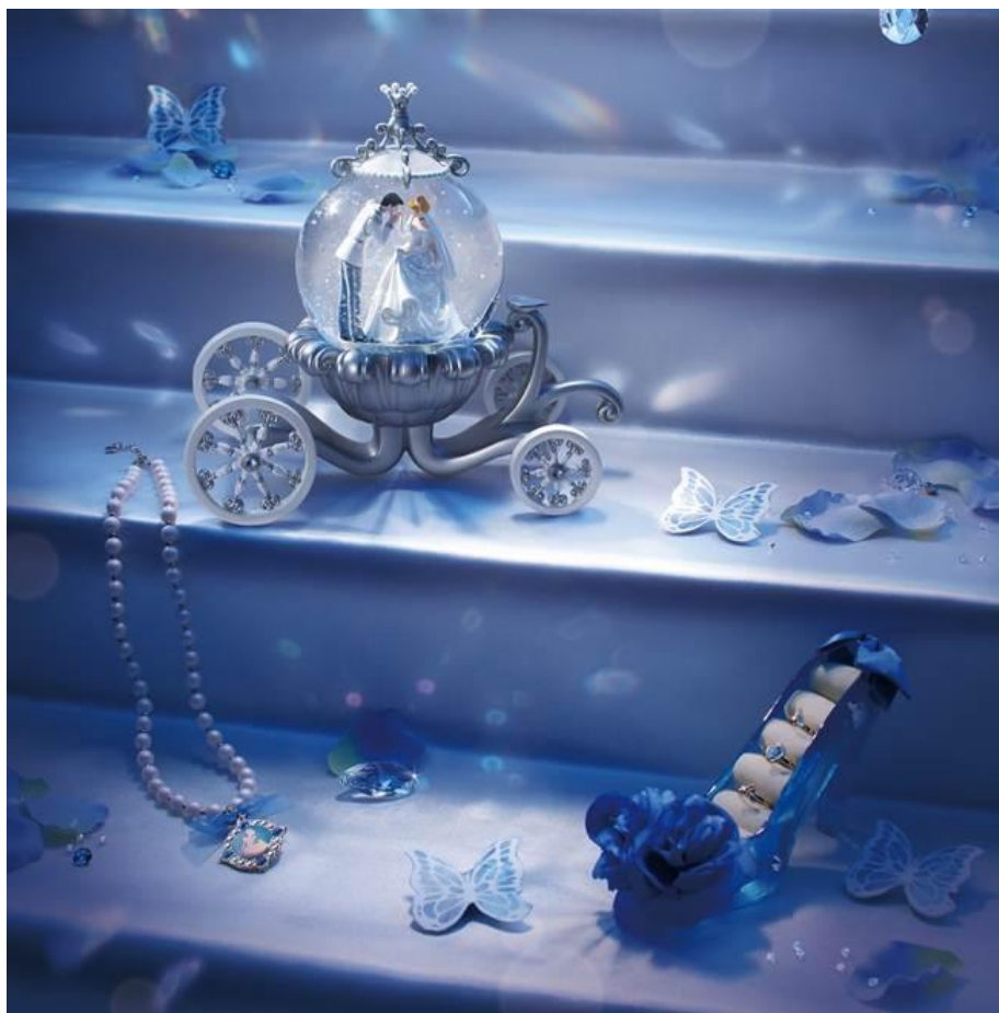
スノーグローブ ¥8,000 リングホルダー ¥2,500

商品は、多くの女性が憧れる、ガラスの靴のリングピローやカボチャの馬車のスノーグローブ、シンデレラのドレスをイメージしたオーガンジーをあしらったTシャツやトートバッグ、パレッタ等、これまでにないシンデレラの世界観を表現しており、シンデレラファンはもちろん、誰もが手元に置いておきたくなるようなアイテムです。