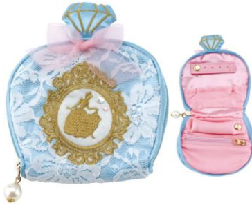
■ジュエリーポーチ ¥2,000