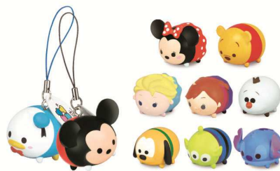
ゲームと連動したアーケード版限定のツムマスコットも新たに5種類が公開