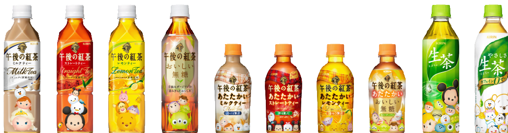
※画像は対象商品の一部となります。