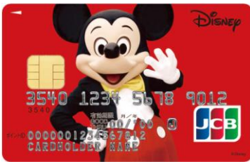
ミッキー・マウス(レッド)