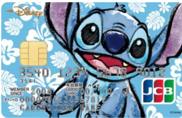
スティッチ(ハイビスカス)