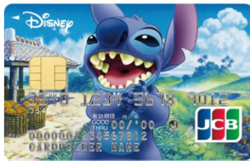
スティッチ(アイランド)