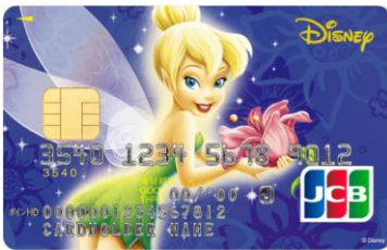
ティンカー・ベル