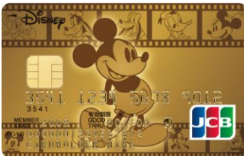
ミッキー・マウス&フレンズ