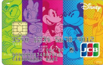
ディズニー★JCBカード5周年記念ミッキー&フレンズカード ※2015年3月31日(火)受付分まで