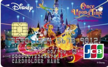
ワンス・アポン・ア・タイム記念カード ※2015年3月31日(火)受付分まで