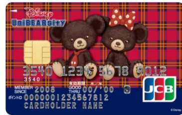
ユニベアシティ(モカ・プリン)