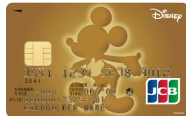
ミッキー・マウス(ゴールド)