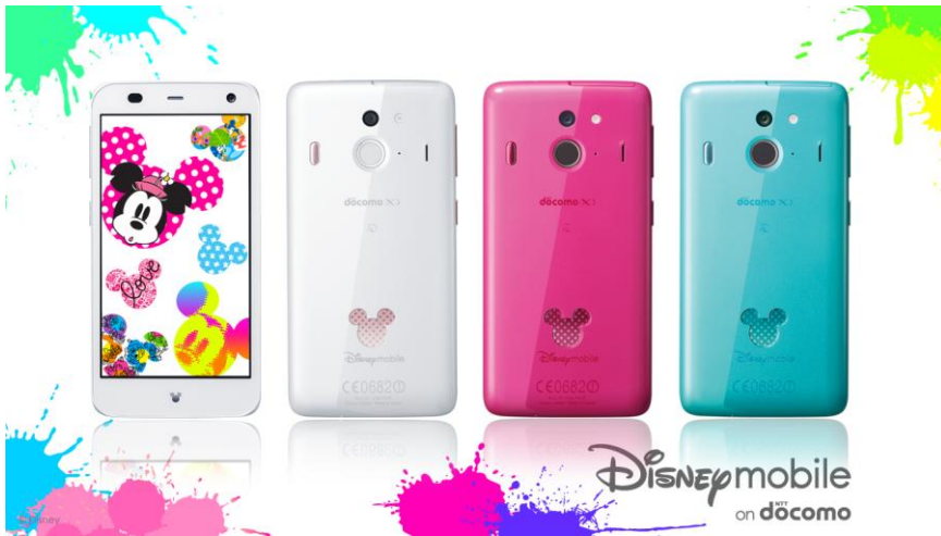
Disney Mobile on docomo 「F-03F」