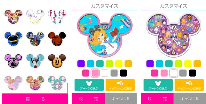
Disney 101 Art Alarm