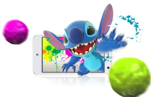
スティッチ・ペイント・スラッシュ