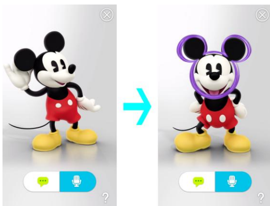
ハローミッキーライブ壁紙