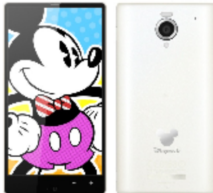
ディズニー・モバイル・オン・ソフトバンク「DM016SH」

～5.2インチの大画面、16.3Mの高解像度カメラ 大容量バッテリーを搭載し、Hybrid 4G LTEに対応～