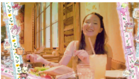
Disney Movie Memories

制限時間内にふたつの絵の中の間違いを探して高得点を目指します。ゲームには、大画面を生かした高品質な Disney アートが使われ、全体を通じてスピード感や爽快感が溢れる間違いさがしゲームです。