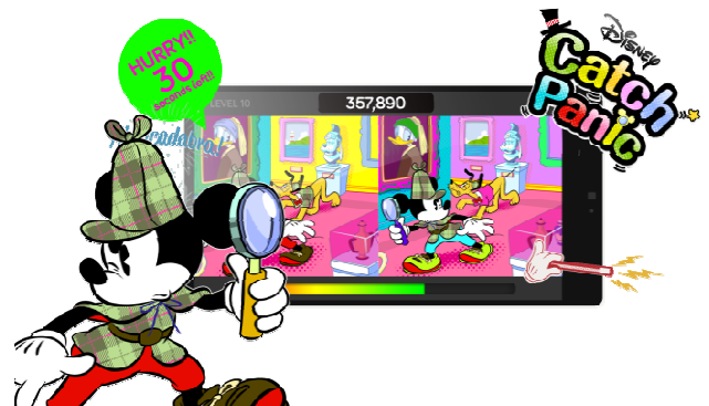
Disney Catch Panic(仮)