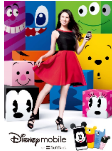
DM015K グラフィック広告より

様々なキャラクターが登場する、この夏にぴったりな POP・COLORFUL・PLAYFUL なテレビCMに是非ご注目ください。