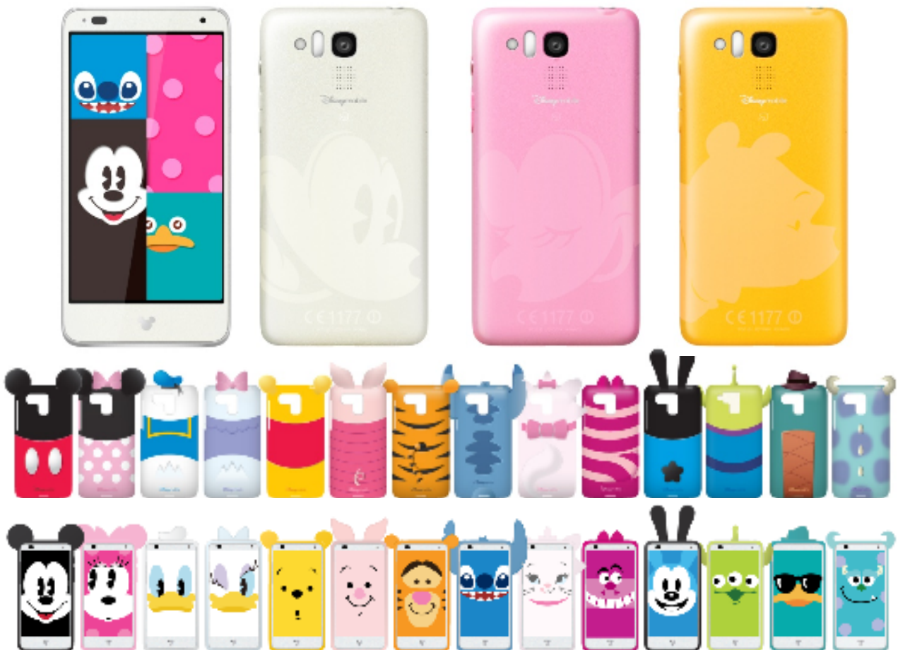
DM015Kと購入特典のオリジナルケース(上)、キャラクターの顔のライブ壁紙(下)

また、新たにドナルドダックとのインタラクティブな遊びが楽しめるアラームアプリ、「Disney Wake Up - Donald」やゲームアプリ「Disney Toy Rush」、音楽プレイヤー「Disney Music Player」を7月下旬より順次提供開始します。