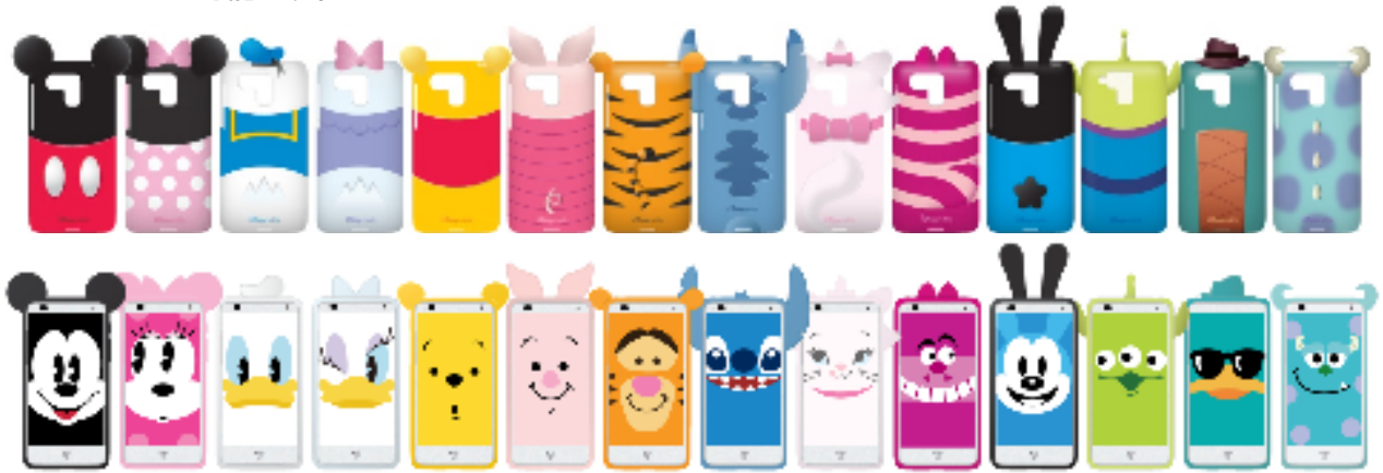
選べる10種類以上のキャラクターケース(上)、キャラクターの顔のライブ壁紙(下)

「マルチキャラクター」をテーマに開発したDM015Kは、端末デザイン、選べる10種類以上の立体的なケース、ライブ壁紙やウィジェットにいたるまで、多数のキャラクターを用意し、自分好みのキャラクターのスマートフォンにカスタマイズが可能です。