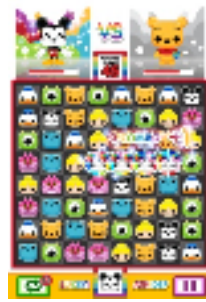
Disney Toy Rush(仮)