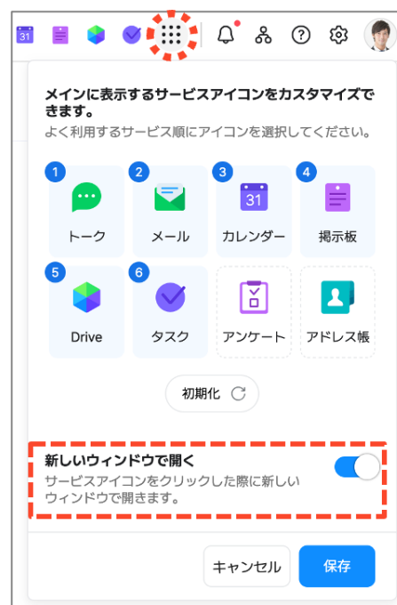
サービスアイコンの並び替え・ウィンドウ設定

チャットやスタンプはもちろん、掲示板、カレンダー、アドレス帳、アンケートなど、現場で活用できる充実したグループウェア機能を揃えたビジネスチャットです。コミュニケーション