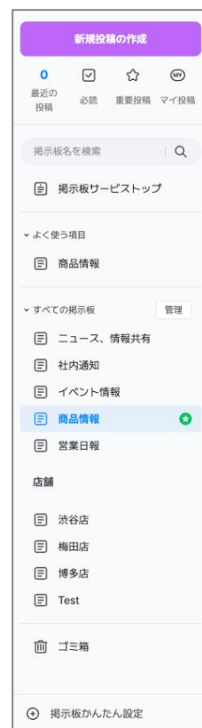
左側メニューの改善

また、利用頻度の下がった掲示板を削除せずに非公開にできる“アーカイブ機能”も追加しました。アーカイブされた掲示板は掲示板一覧には表示