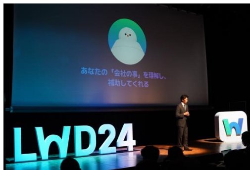
2024年5月に東京で開催した「LINE WORKS DAY 24」