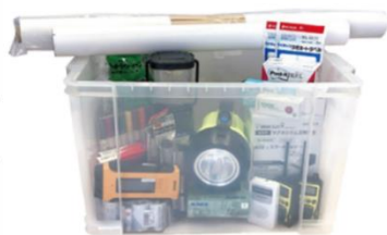
防災情報機器・文具セット