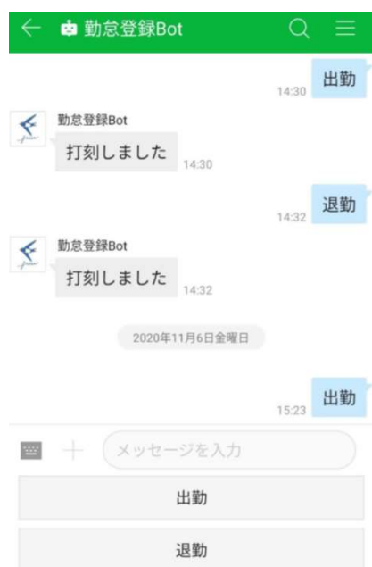
左：スマートフォンイメージ