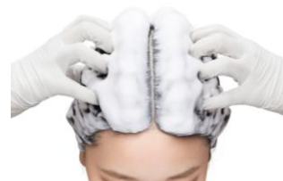
濃密泡が根元に密着