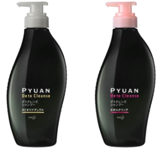
まとまりナチュラル