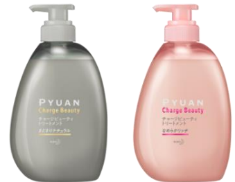
まとまりナチュラル