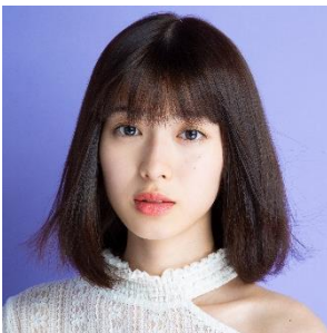
白石 聖(しらいし せい)

1998年8月10日生まれ。神奈川県出身。女優として活動中。 2016年6月にドラマ『AKBラブナイト 恋工場』(テレビ朝日)で女優デビュー。2019年、「美少女タレントの登竜門」とも言われる結婚情報誌(リクルート)『ゼクシィ』12代目CMガールに起用され、その後はテレビドラマや映画などで活躍中。