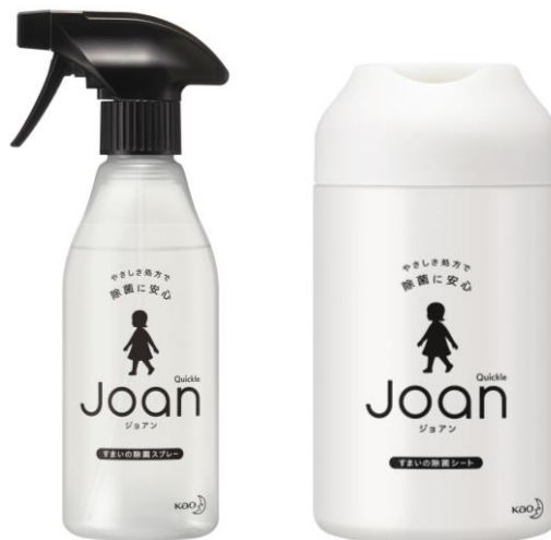
左から、『クイックル Joan 除菌スプレー』『クイックル Joan 除菌シート』